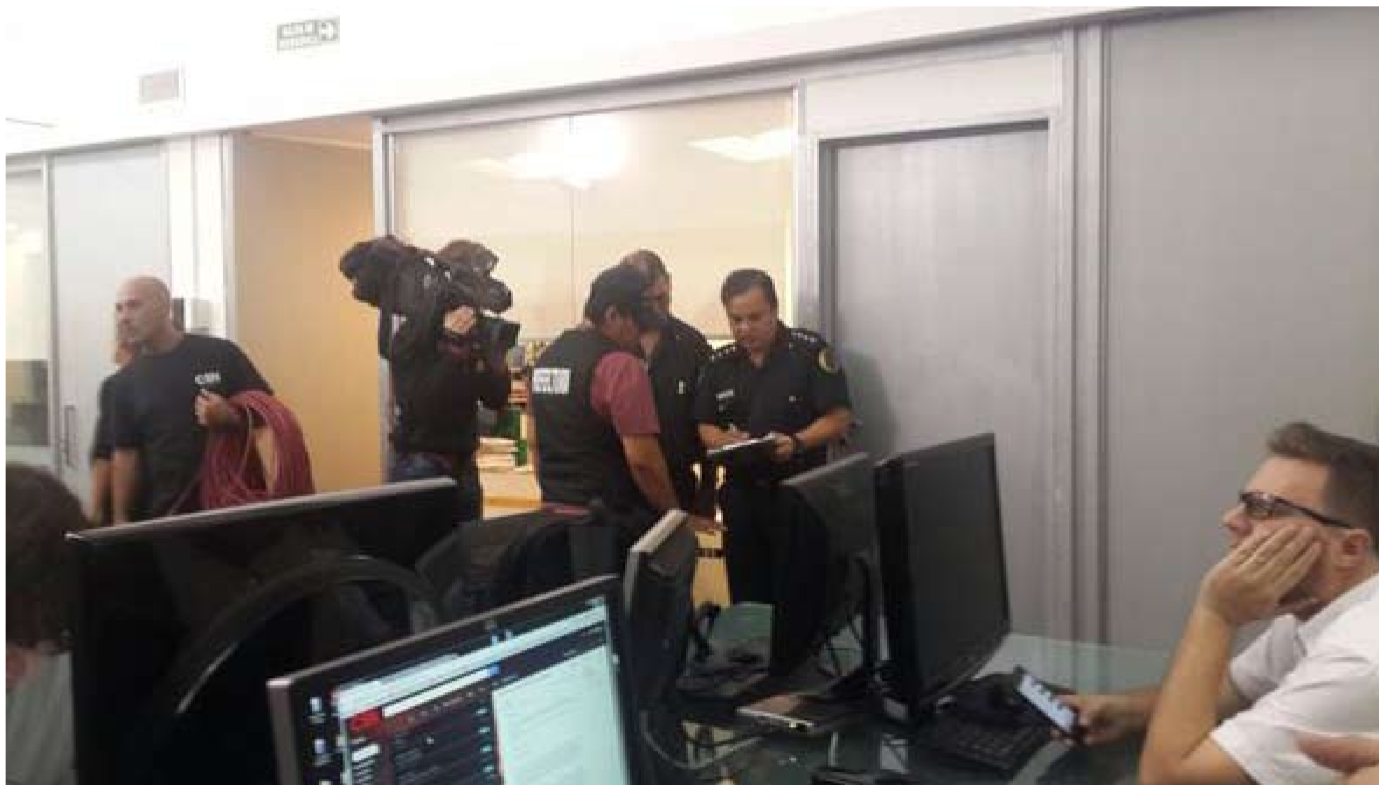
Las fuerzas de seguridad que allanaron C5N tuvieron una actitud hostil hacia los trabajadores del canal. Pero los negocios de las patronales no tienen nada que ver con los trabajadores.