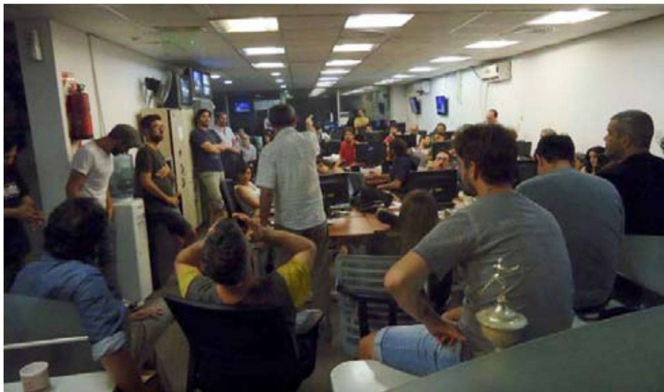
La redacción busca, con gran entusiasmo, desafiar nuevamente el lock out patronal, visibilizar el conflicto y llevar unos pesos a casa.

En la edición, de 16 páginas, participarán todas las secciones que conforman el diario referenciadas en una consigna unificadora: "El trabajo es un derecho humano". Desde esa perspectiva unificadora harán su aporte los periodistas de espectáculos, de deportes, de política, de economía, internacionales, sociedad, policiales e investigaciones. Además,