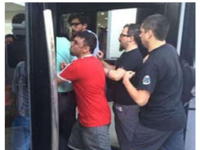
Los trabajadores de CN23 tomaron el canal el 29 de febrero.

Si bien la audiencia terminará de definir la situación de los trabajadores, la discusión desde el inicio del conflicto y a futuro que están llevando adelante los trabajadores, es la operatividad del canal. Ya que la cantidad de trabajadores, fue uno de los argumentos utilizados por Indalo para tomar la drástica medida que dejó prácticamente desgastado de personal, al canal de noticias. «