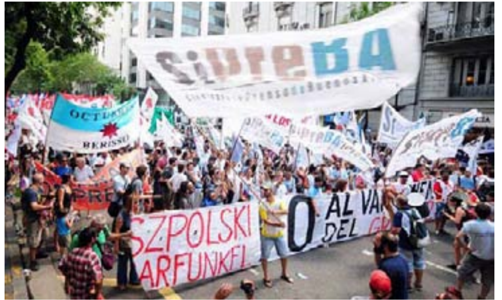
Los trabajadores de Tiempo Argentino volverán a las calles para reclamar por su salarios impagos.

Es una forma de unir en la misma marcha a los empresarios corruptos y vaciadores que no pagaron los salarios de diciembre, enero y febrero más el medio aguinaldo, con los funcionarios macristas que no se hacen cargo de esta situación, ni multando a la empresa ni pagando los repes, ni siquiera recibiendo a los delegados de los trabajadores ni al sindicato.